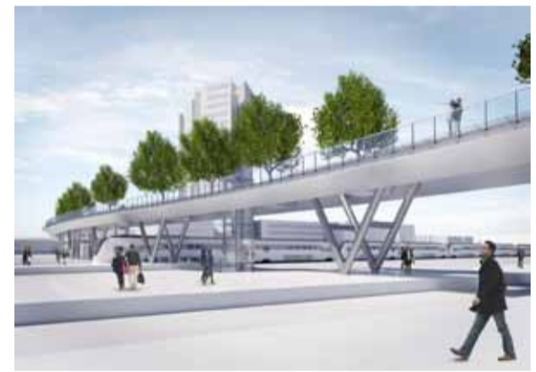
Impressie nieuwe brug

Iedereen die vragen heeft over de inhoud van het bestemmingsplan en de procedure, kan terecht bij het 'inloopspreekuur' op maandag 15 juli, tussen 17.30 en 19.30 uur in het Infocentrum Stationsgebied.