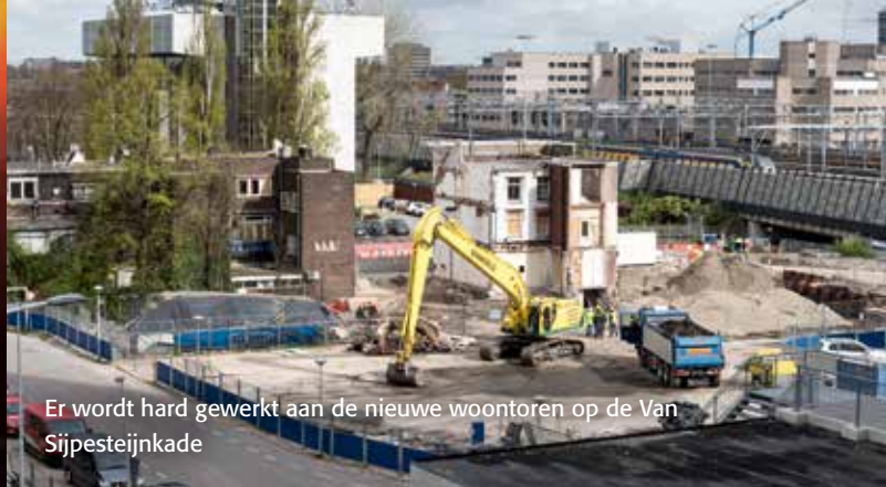
Er wordt hard gewerkt aan de nieuwe woontoren op de Van Sijpesteijnkade

F World Trade Center | 14 etages kantoor | CBRE Global Investors | klaar 2018