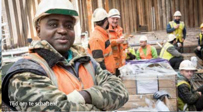
Tijd om te schaffen!