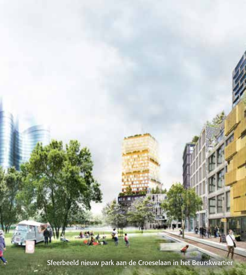
Sfeerbeeld nieuw park aan de Croeselaan in het Beurskwartier