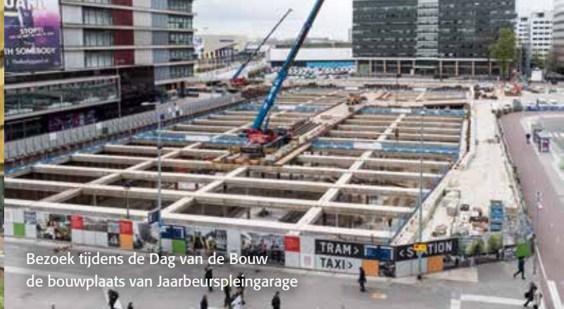
Bezoek tijdens de Dag van de Bouw de bouwplaats van Jaarbeurspleingarage