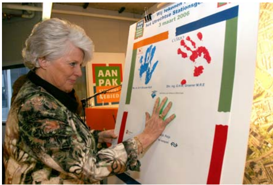
Minister Peijs zet haar Handtekening

Stand van zaken: deze motie is meegenomen in de toetsing van het Definitief Ontwerp van de OV-Terminal. De commissie wordt hier in juni over geïnformeerd.