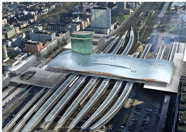
Definitief ontwerp OV-Terminal

De beschikking van de Minister van Verkeer&Waterstaat van 250 miljoen EUR aan de subsidie-ontvanger, te weten ProRail is in oktober 2006 gepland. De voorbereiding van uitvoering is vervolgens nog eind van dit jaar te verwachten. In 2007 zal de feitelijke uitvoering op gang komen. De afronding is in 2011/2012 gepland.