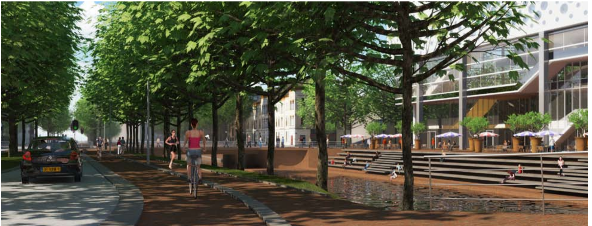
Toekomstige Catharijnesingel ter hoogte van het Muziekpaleis.

Wilt u weten en zien welke maatregelen dit zijn, met ons meedenken, tips geven? Voor de zomer komt er een avond in het Infocentrum Stationsgebied, waar u kunt meepraten en informatie kunt krijgen over de eerste fase van de uitvoering. De datum van deze avond wordt op een later tijdstip bekendgemaakt op de website cu2030.nl en in deze krant.