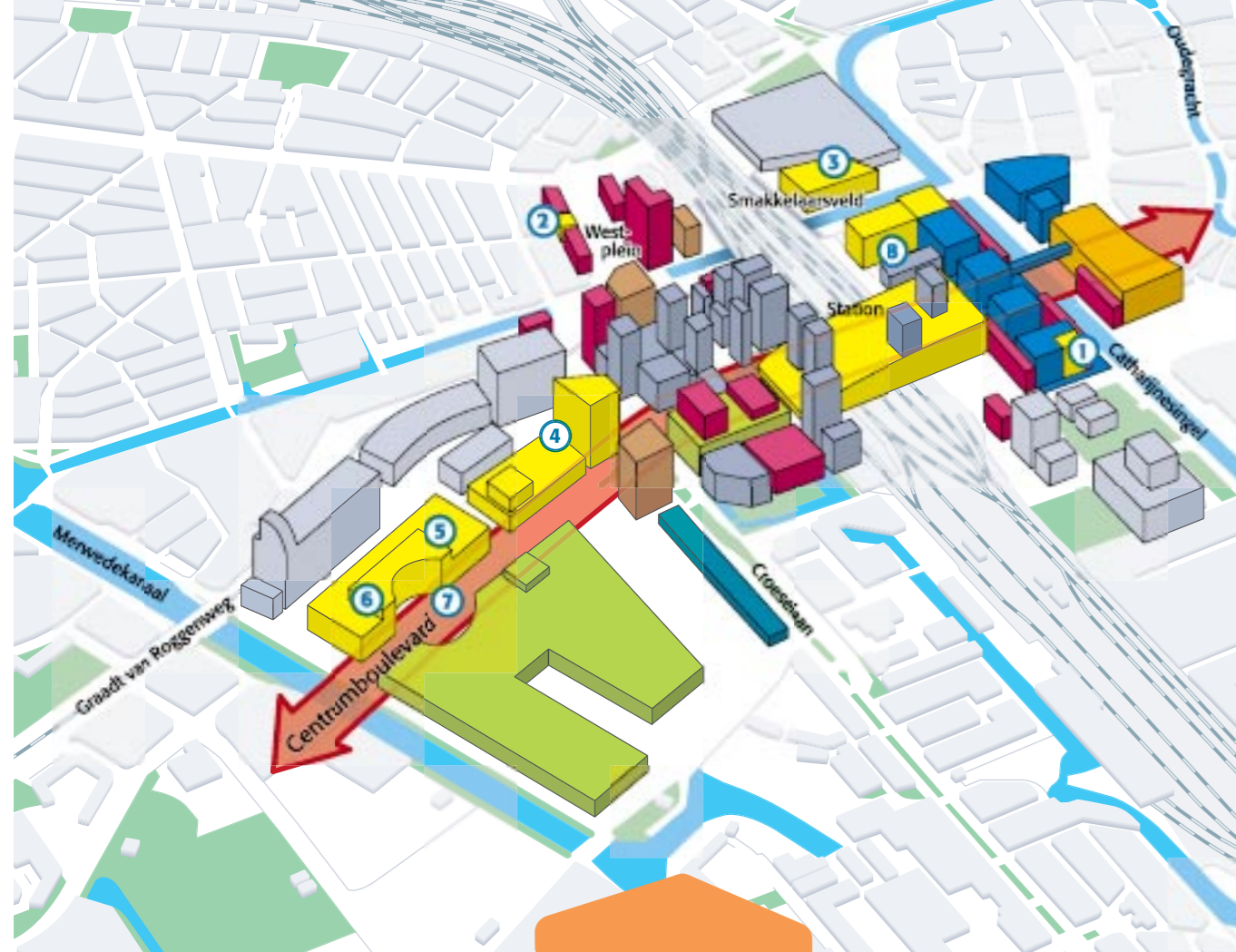
Legenda Visie 1